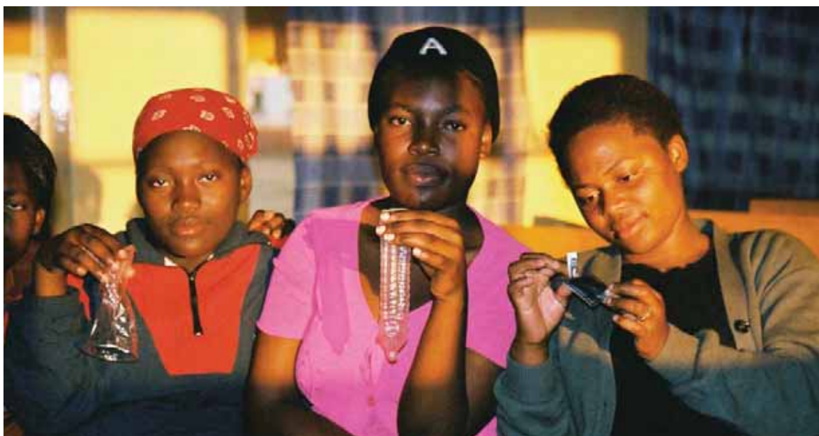
“Тренеры из среды подростков демонстрируют сверстникам способы правильного использования презервативов. Южная Африка.”

Люди, живущие с ВИЧ/СПИДом, а также группы населения с повышенным риском заражения и восприимчивостью к ВИЧ-инфекции имеют право на получение доступа к полному набору товаров и услуг. Сюда относятся и профилактические мероприятия, подтвердившие свою эффективность, например, распространение и использование презервативов. Однако, неспособность устранить факторы, осложняющие приобретение и использование презервативов, является одной из наиболее острых проблем, которая не позволяет предотвратить миллионы новых случаев заражения ВИЧ-инфекцией.