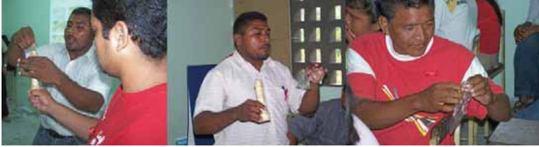
Семинар на тему предотвращения СПИДа и о правильном использовании презервативов, Сообщество Юкпа, Венесуэла.

Многие религиозные организации и правительства стран, поддерживающих религиозные воззрения, приняли концепцию профилактики «АВС»: «воздерживайся от беспорядочных связей, храни верность и пользуйся презервативами». 27 Нередко основной упор делается на воздержание и верность партнеру, а использование презервативов оставляют тем, кто не способен удержаться в рамках «требований морали». Эта концепция «АВС» не дает возможности применить комплексный подход к профилактике ВИЧ/СПИДа, включающий, например, расширение прав, изучение проблем сексуальности и выработку навыков поведения. Такой подход вызывает большие сомнения, так как усиливает общественное порицание и дискриминацию лиц, пользующихся презервативами. 28