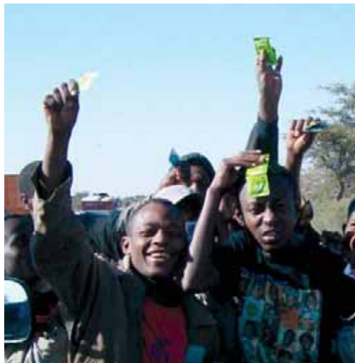
Работа с молодежью, Эфиопия.

В Марокко, где большинство молодых людей знают о существовании ВИЧ/СПИДа, предоставления о профилактике крайне ограничены даже среди городской молодежи. Исследования, проведенные среди студентов колледжа показывают, что менее двух третей мужчин и лишь одна треть женщин имеют представление о том, что презерватив является средством профилактики. Уровень знаний среди необразованной или малообразованной марокканской молодежи удручающе низок. 93 Недавно проведенный международный обзор 94 показал, что девушки, получившие полное среднее образование, имели более низкий риск заражения ВИЧ-инфекцией и чаще использовали средства защиты во время сексуальных контактов, чем девушки, закончившие только начальную школу.