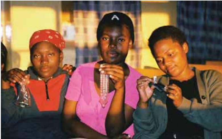
Тренеры из среды подростков демонстрируют сверстникам способы правильного использования презервативов. Южная Африка.

Однако высокая цена частично объясняется низким спросом и ограниченным предложением на мировых рынках сбыта. Например, в 2004 г. в Южной Африке в продажу было выпущено 346 миллионов мужских презервативов и лишь 2,6 миллиона женских. 79 Если бы женские презервативы активно продавались и рассматривались бы не только как средство профилактики, но и как средство получения сексуального наслаждения, их популярность и, следовательно, доступность значительно возросла бы во многих странах мира.