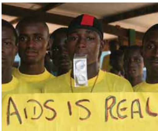
1 СПИД – это реальность, - говорит надпись на фотографии. Тренеры из среды подростков, участвующих в проведении Всемирного Дня СПИД в Сьерра-Леоне. *

Настоящая Краткая информационная справка содержит анализ некоторых факторов, затрудняющих свободное распространение презервативов, который проведен на базе результатов исследования общественных групп «низового уровня» при финансовом содействии ICASO. Информация была взята из проведенной общественными организациями в 2005 и 2006 годах программы по оценке выполнения положений Декларации о приверженности делу борьбы с ВИЧ/СПИДом, принятой на Специальной сессии Генеральной ассамблеи ООН по ВИЧ/СПИДУ (ЮНГАСС). 1