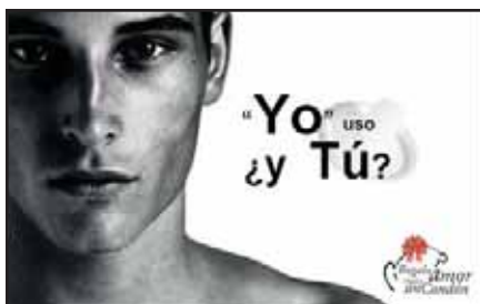
Я использую презерватив, а ты? – кампания популяризации использования презервативов в среде молодых геев, Буэрнавака, Мексика