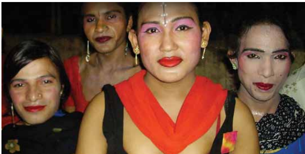
Трансгендерные работники коммерческого секса на стоянке грузовиков.